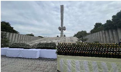
＜慰霊塔を前に式典が行われました＞

全国の空爆犠牲者を慰霊し、世界の恒久平和を祈念する日本唯一の施設となる慰霊塔前の会場に、各戦災都市の遺族をはじめ全国各地から多くの方が参列されました。