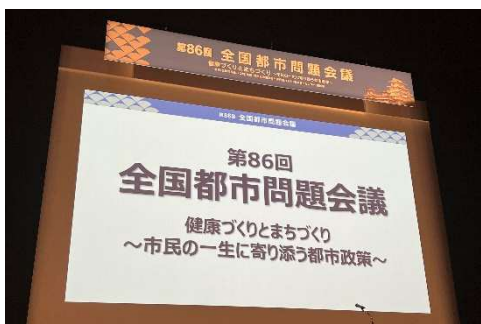
＜アクリエひめじにて開催＞

をテーマとして取り上げ、学識者や都市行政関係者等による多面的な報告・討議がありました。