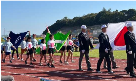
＜スポーツ祭開会式の様子＞

開会式後、陸上競技場ではリレー競技が、体育館ではさまざまなスポーツの体験会が行われました。