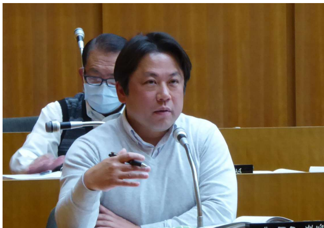
3日間にわたり新年度予算を調査しました！