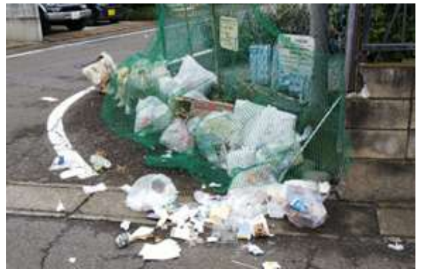
散らかったごみステーション