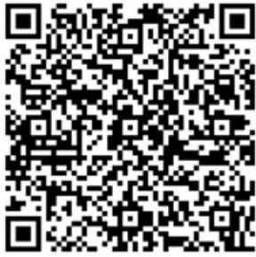
大泉町HP「さくらサポーター制度」

また、このさくらサポーター制度は、当時、中学生だった子から、「桜を切らないでほしい」との声を受け、提言させていただいた施策になります。 小さな声でも形に出来たことは嬉しく思います。