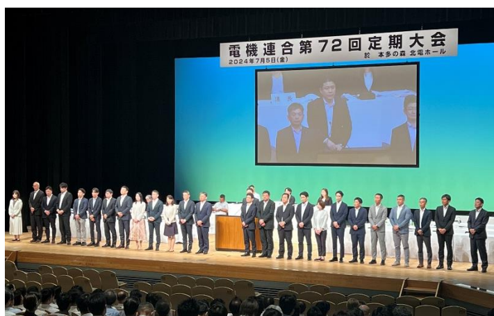
可決承認された電機連合新役員体制