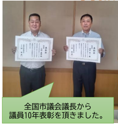
全国市議会議長から議員10年表彰を頂きました。