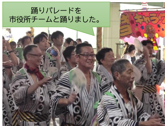
踊りパレードを市役所チームと踊りました。