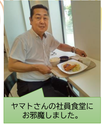
ヤマトさんの社員食堂にお邪魔しました。