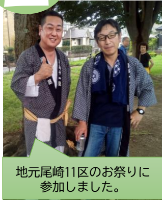
地元尾崎11区のお祭りに参加しました。