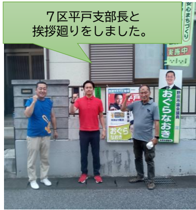
7区平戸支部長と挨拶廻りをしました。