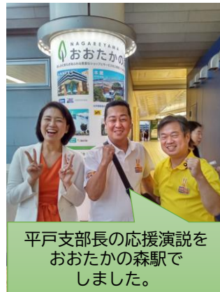
平戸支部長の応援演説をおおたかの森駅でしました。