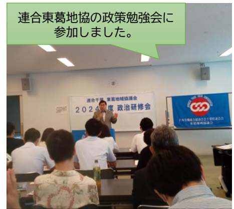
連合東葛地協の政策勉強会に参加しました。