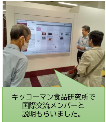
キッコーマン食品研究所で国際交流メンバーと説明をもらいました。