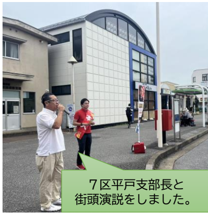
7区平戸支部長と街頭演説をしました。