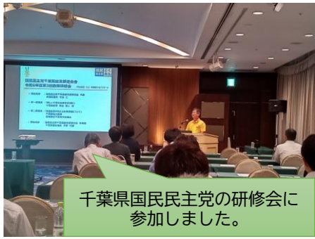
千葉県国民民主党の研修会に参加しました。