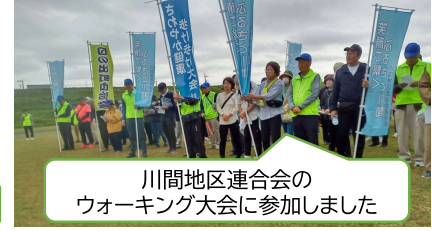
川間地区連合会のウォーキング大会に参加しました