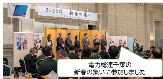
電力総連千葉の新春の集いに参加しました