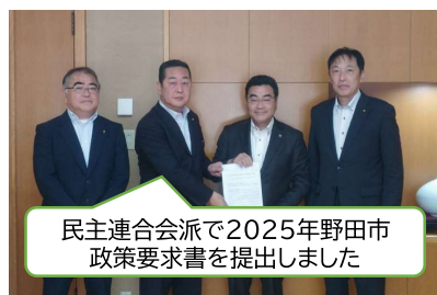
民主連合会派で2025年野田市政策要求書を提出しました