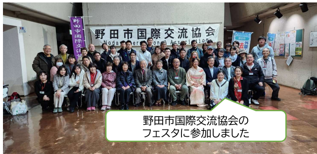
野田市国際交流協会のフェスタに参加しました