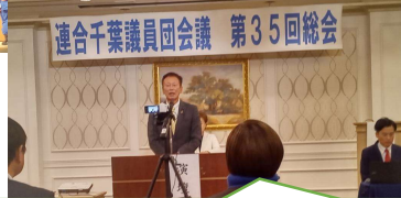
第35回連合議員団会議に参加しました