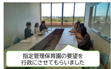
指定管理保育園の要望を行政にさせていただきました