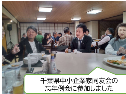
千葉県中小企業家同友会の忘年例会に参加しました