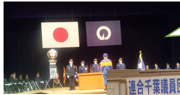
消防出初式に参加しました