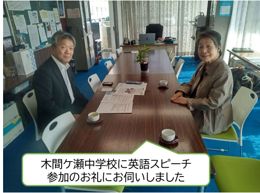
木間ヶ瀬中学校に英語スピーチ参加のお礼にお伺いしました