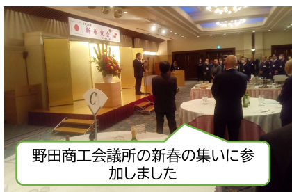
野田商工会議所の新春の集いに参加しました