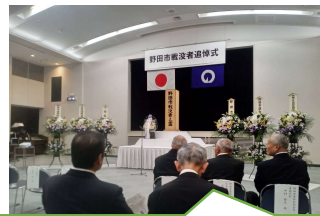
野田市戦没者追悼式に参加しました