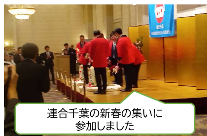
連合千葉の新春の集いに参加しました