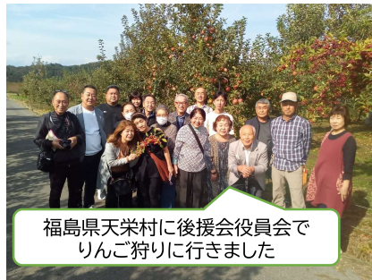
福島県天栄村に後援会役員会でりんご狩りに行きました