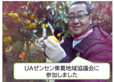
UAゼンゼン東葛地域協議会に参加しました