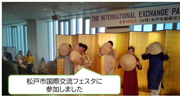
松戸市国際交流フェスタに参加しました