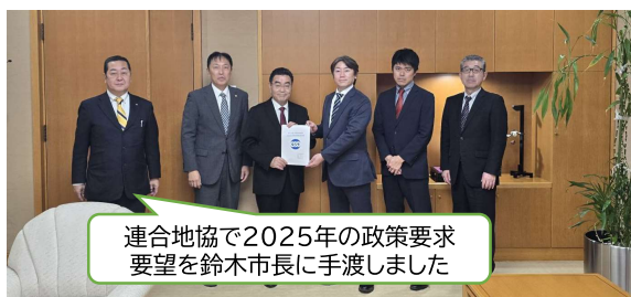
連合地協で2025年の政策要求要望を鈴木市長に手渡しました