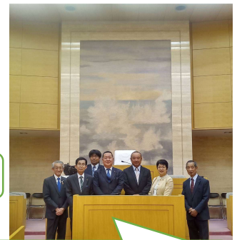
別府市へ「外国人留学生との連携による町づくり」について視察しました