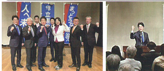
4/7 千葉県第5区総支部時局講演会