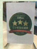
NPOより三ツ星議員に選出(2019.11/2023.2)