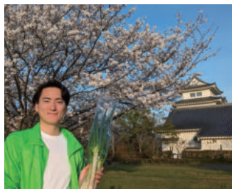
関宿城さくらまつり