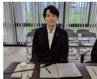
千葉県議会 文教常任委員会