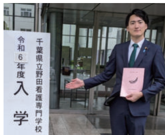
県立野田看護専門学校 入学式