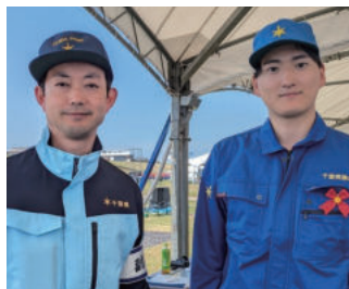
利根川水系連合・総合水防演習、熊谷千葉県知事と