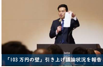
「103万円の壁」引き上げ議論状況を報告