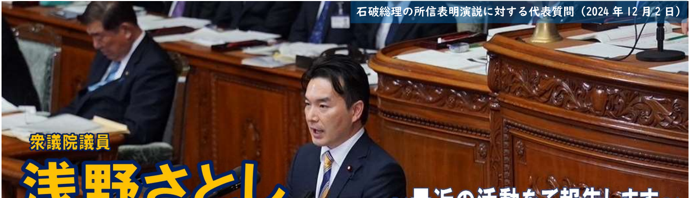
石破総理の所信表明演説に対する代表質問 (2024年12月2日)