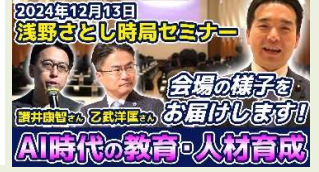
▲当日の様子はこちらから(Youtube)