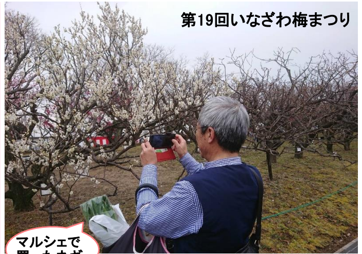
マルシェで買ったネギ