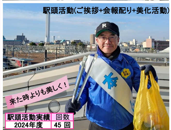
駅頭活動(ご挨拶+会報配り+美化活動)