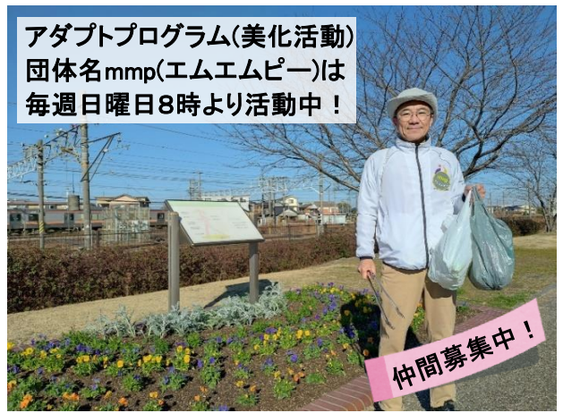
アダプトプログラム(美化活動) 団体名mmp(エムエムピー)は 毎週日曜日8時より活動中！

4. 救急安心センター事業(#7119) ・名古屋市が2024年7月に開始し、その事業効果を確認し愛知県内への展開を検討 ・愛知県では夜間・休日等の医療機関の案内、小児救急電話相談などの事業を展開(下記参照)