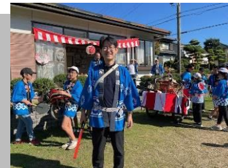
地域や市の行事に呼んでいただき、市民の方々と会話する機会を頂く