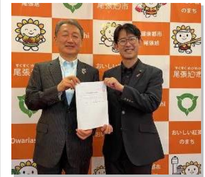
オール尾張旭でより良いまちづくりを推進