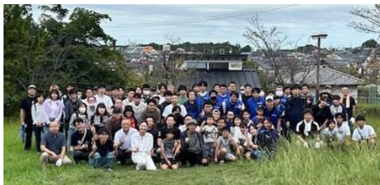
市民祭前に各企業の組合員と城山公園を清掃