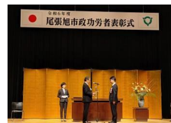
永年にわたる消防団活動に対し代表して表彰いただいた