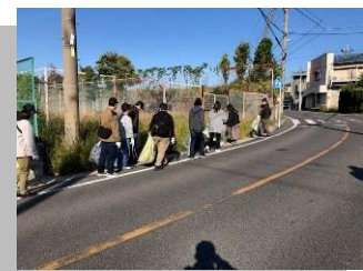
旭精機、旭サナック労組による地域清掃活動に参加