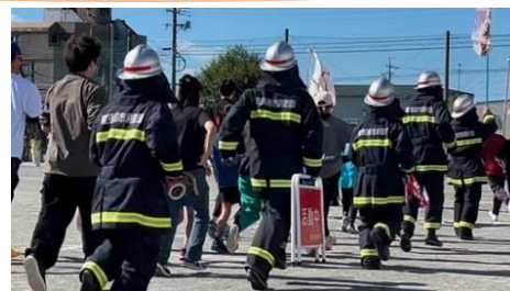
頼もしい消防団の後ろ姿（地元運動会にて）