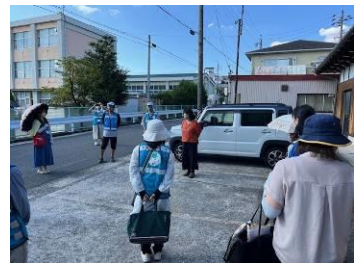
下校パトロールに参加