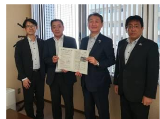
陳情、提言活動も活発に実行