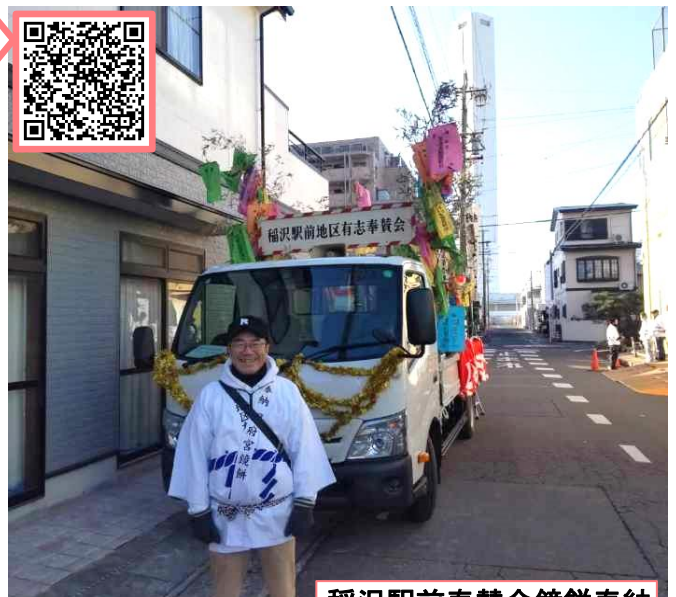
稲沢駅前奉賛会鏡餅奉納